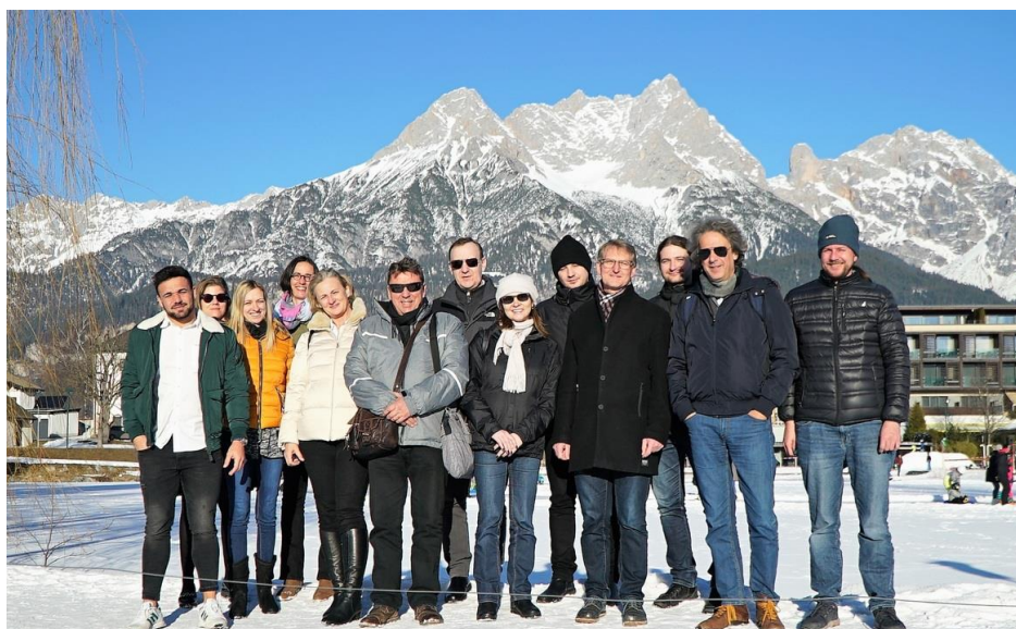
Zespół DigiCulTS podczas spotkania inauguracyjnego w Saalfelden w styczniu 2020 roku. Wspólna praca na rzecz wspierania MŚP w rozwijaniu kompetencji cyfrowych.

"DigiCulTS - Digital Culture for SMEs" to projekt Erasmus+, którego celem jest wspieranie Małych i Średnich Przedsiębiorstw (MŚP) w znalezieniu swojego miejsca w społeczeństwie cyfrowym.