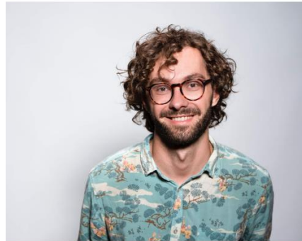
Meet Peter! This is an example of an persona I came up with.

Με συγχρηματοδότηση από το πρόγραμμα «Erasmus+» της Ευρωπαϊκής Ένωσης