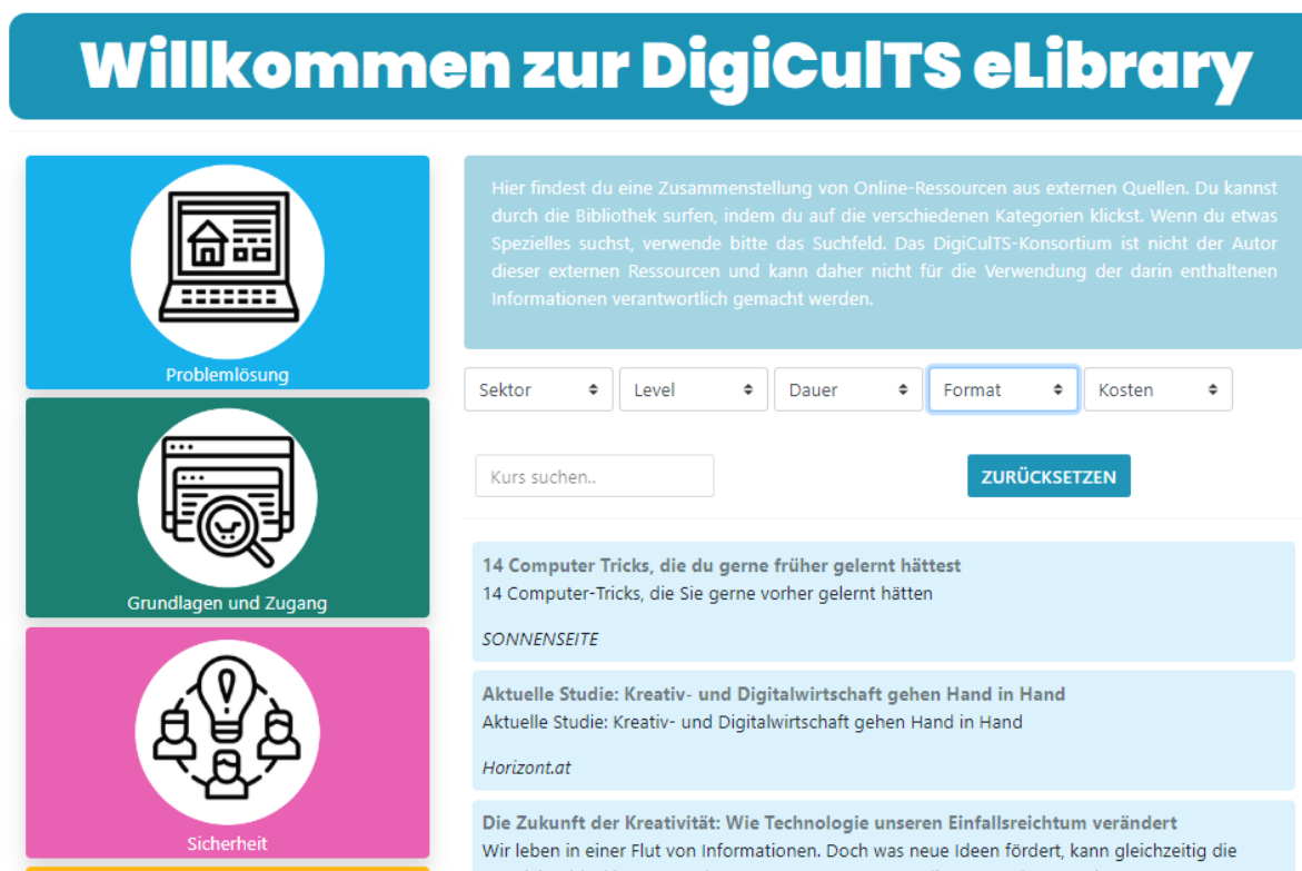
Abbildung 1: Die DigiCulTS eLibrary

Nutzen Sie unsere eLibrary und erfahren Sie mehr über spezifische Aspekte der Digitalisierung und der digitalen Transformation in verschiedenen Sektoren.