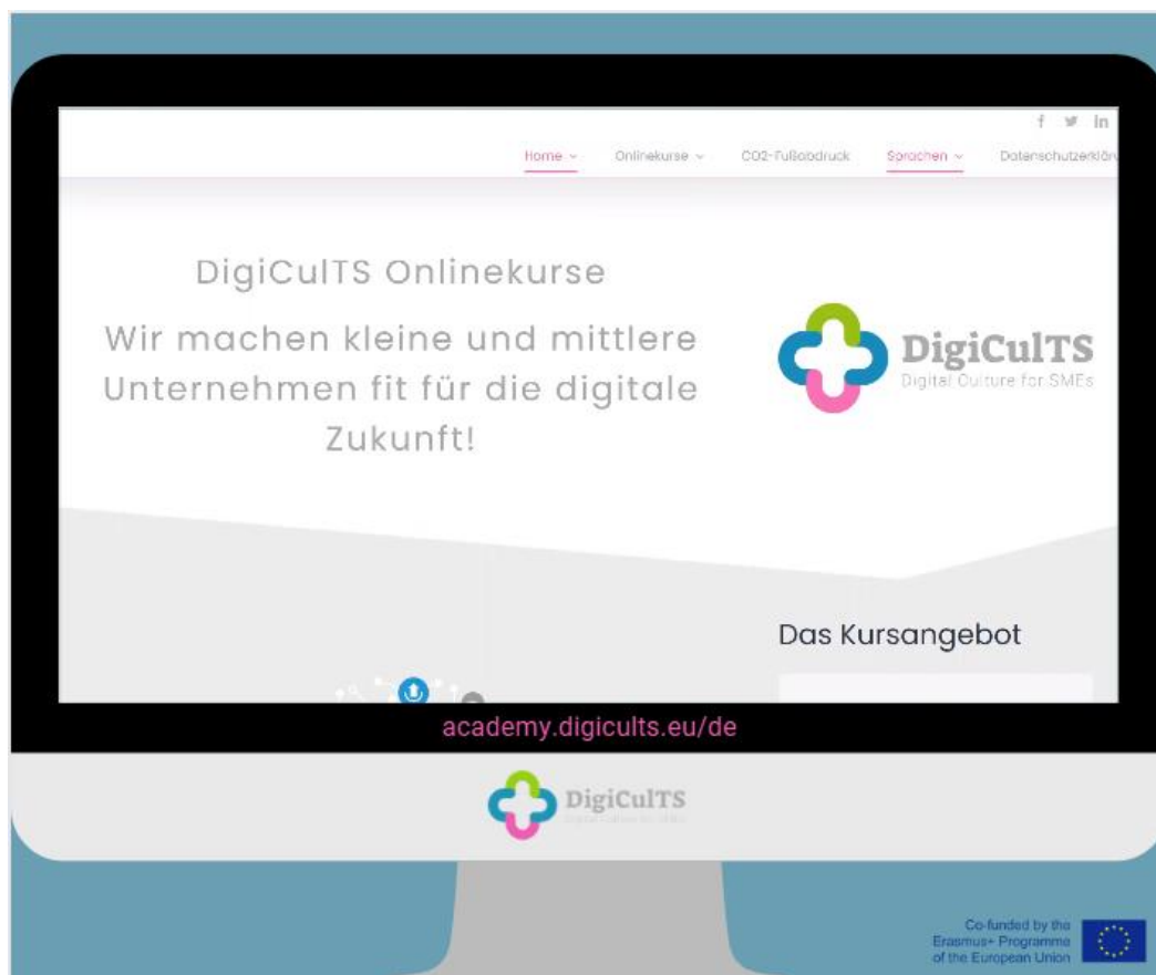
Figura 2: Echa un vistazo a nuestro video promocional en nuestra plataforma de aprendizaje en línea.

¿Por qué elegir aprender con DigiCulTS? Nuestros cursos se basan en la investigación, contienen muchos ejemplos prácticos de varias pequeñas y medianas empresas de toda Europa. No es necesario registrarse, y puede acceder y completar los cursos a su propio ritmo .